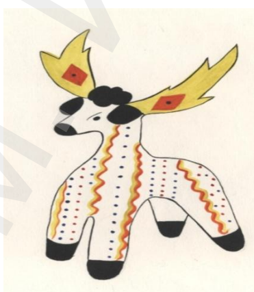
Олень. Дымковская игрушка г. Киров