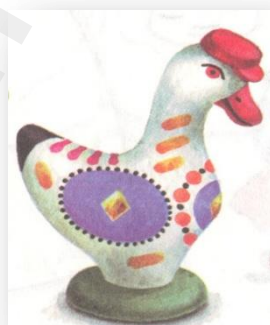
Утица. Дымковская игрушка. г. Киров