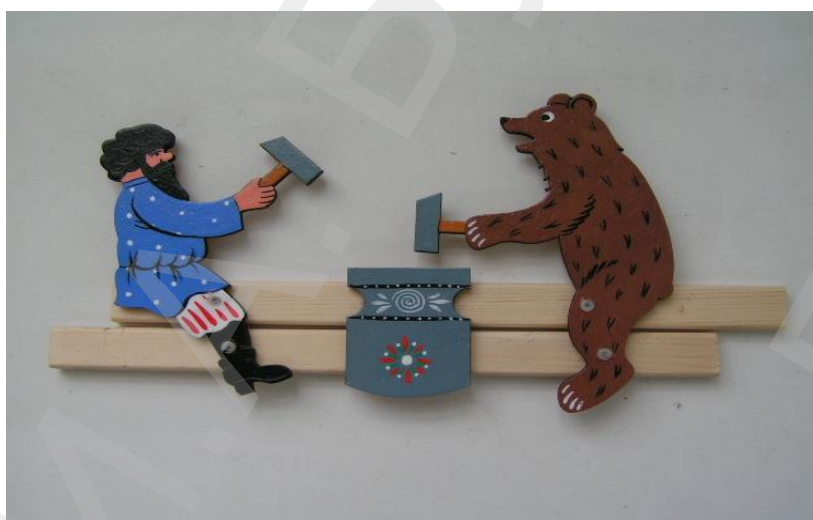
Кузнецы. Богородская игрушка