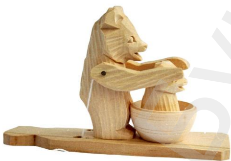
Мишка в бане. Игрушка с балансом. Богородская фабрика художественной резьбы. Дерево, резьба