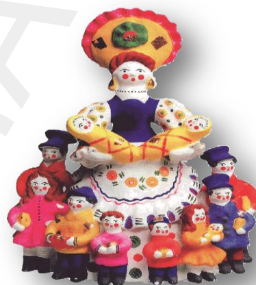
Нянька. Дымковская игрушка г. Киров