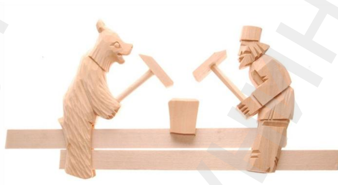
Кузнецы. Игрушка на планках. Богородская фабрика художественной резьбы. Дерево, резьба