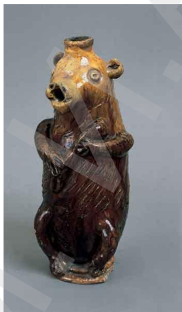
Скопинская керамика. Фигурный сосуд. Медведь.