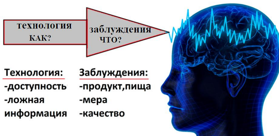
Рисунок 3. Технология манипуляции

Если технологию манипуляции на алкогольно-табачное отравление представить в виде картинки, то мы получим следующее: