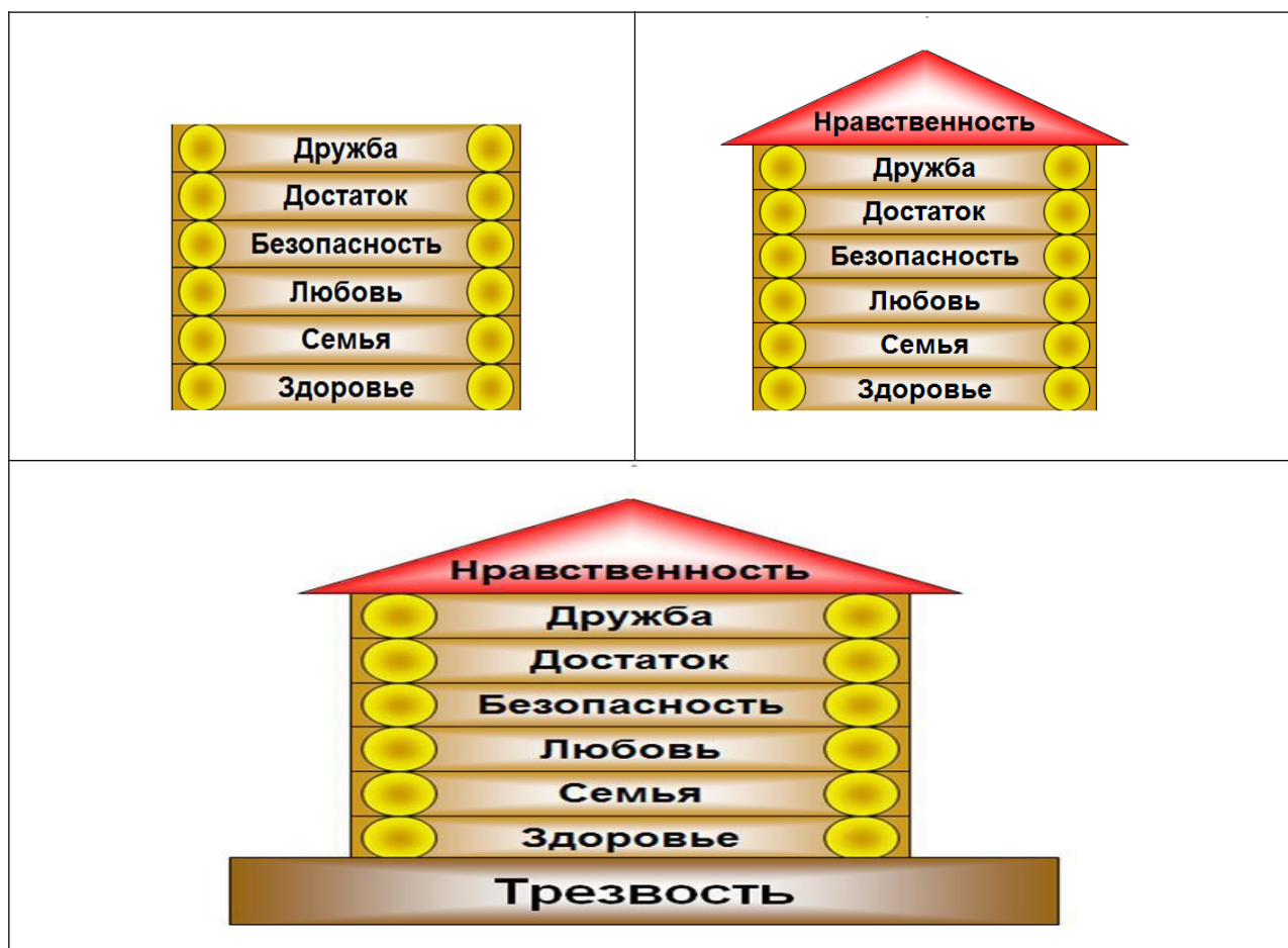
Рисунок 1. Ценности