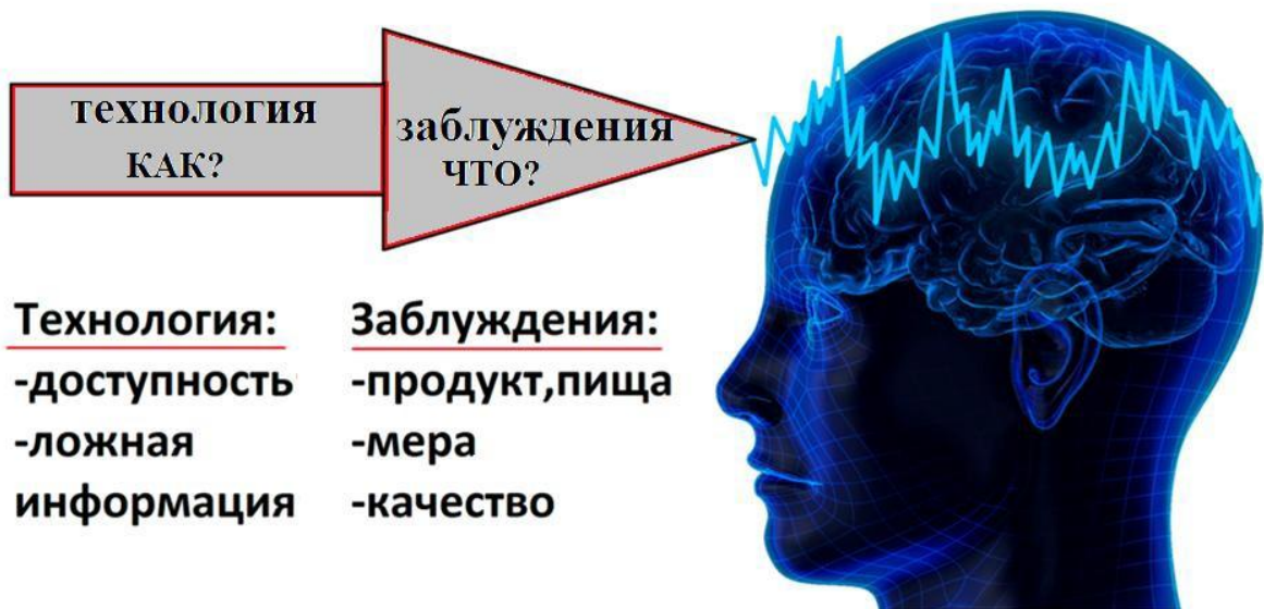
Рисунок 3. Технология манипуляции

После того, как на человека оказано воздействие, он, сам того не замечая, становится запрограммированным. Согласно определению Геннадия Андреевича Шичко, « питейно запрограммированный — верующий в мифические свойства спиртных напитков » [58].