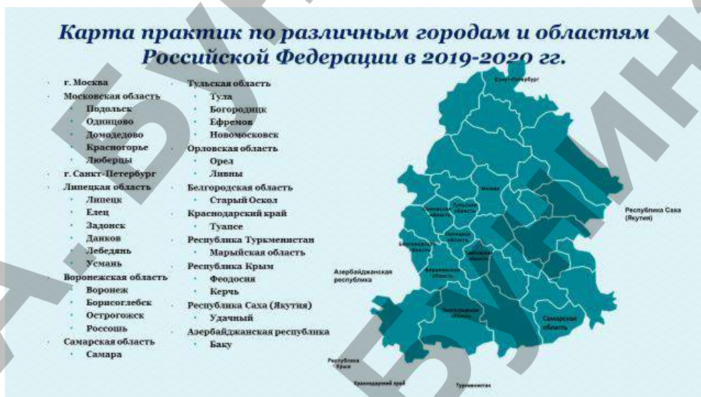
Рисунок 1. Карта практик