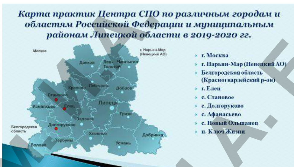
Рисунок 2. Карта практик

В отчетном году в результате прохождения практик трудоустроены 2 обучающиеся института истории и культуры (3 чел.), агропромышленного