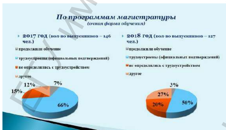
Приложение 7.2. Распределение выпускников 2018 года очной формы обучения по каналам занятости