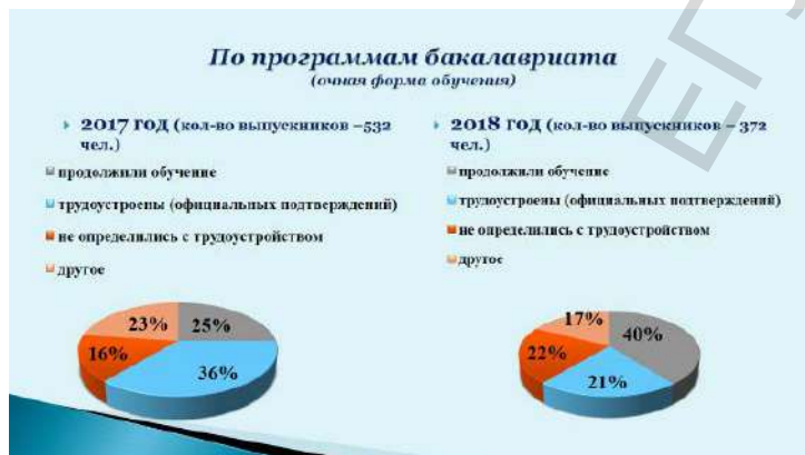
Приложение 7.3. Распределение выпускни-