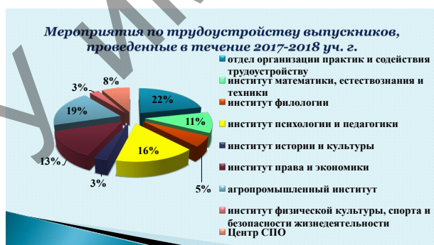
Приложение 7.1. Мероприятия по трудоустройству выпускников (сравнительный анализ за последние 2 учебных года)

Так, прошел мастер-класс ведущих специалистов АО «Энергия» (г.Елец) для выпускников агропромышленного института , состоялись экскурсии обучающихся в туристическое агентство «TRAVEL TOUR» ( институт филологии ), ООО «Черноземье», на 20-ую Российскую агропромышленную выставку «Золотая осень – 2018» (г. Москва) ( агропромышленный институт ), 26-ую Международную туристическую выставку (г. Москва) ( институт истории и культуры ), в Центр поддержки одаренных детей «Стратегия» (г. Липецк) ( обучающиеся всех институтов по направлениям подготовки «Педагогическое образование», «Юриспруденция», «Экономика» ), прошли встречи с представителями учреждений, организаций и компаний: ООО «ГК ТРИО» ( агропромышленный институт ), ООО «ДЖ.Т.И. Елец» ( институт филологии ), ООО «Гарант-Сервис Липецк» ( институт права и экономики ), МБУДО «Детско-юношеская спортивная школа №1» города Ельца ( институт физической культуры, спорта и безопасности жизнедеятельности ) и т.д. (См.: Приложение 7 6 , Приложение 7.1. Мероприятия по трудоустройству выпускников (сравнительный анализ за последние 2 учебных года)).