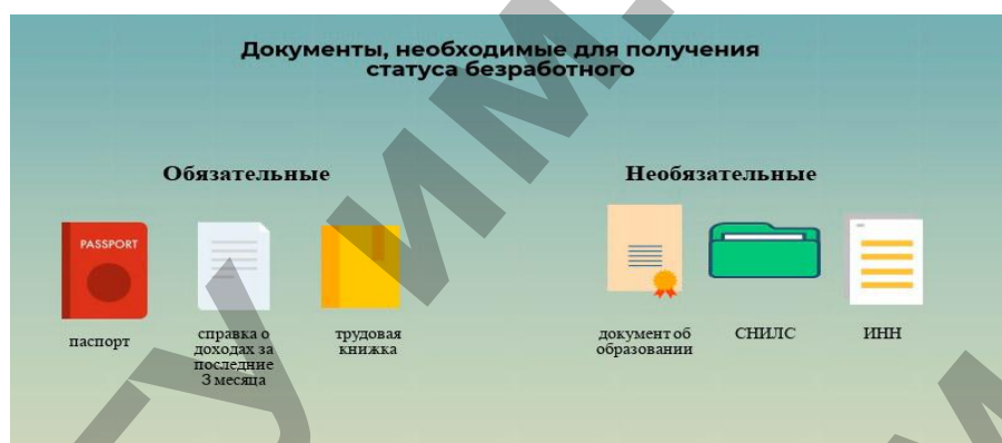
Рисунок 2. Документы, необходимые для получения статуса безработного

Центр занятости вправе не присвоить статус безработного, если гражданин официально не работал без уважительной причины более 5 лет. Встать на учет повторно можно через месяц после того, как центр занятости откажет в присвоении статуса безработного.