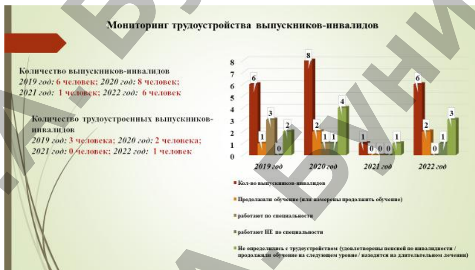
Рисунок 1. Мониторинг трудоустройства выпускников-инвалидов

чинами: серьезное заболевание, отсутствие личной мотивации в трудоустройстве, удовлетворенность пособием, низкий уровень оплаты труда и др.