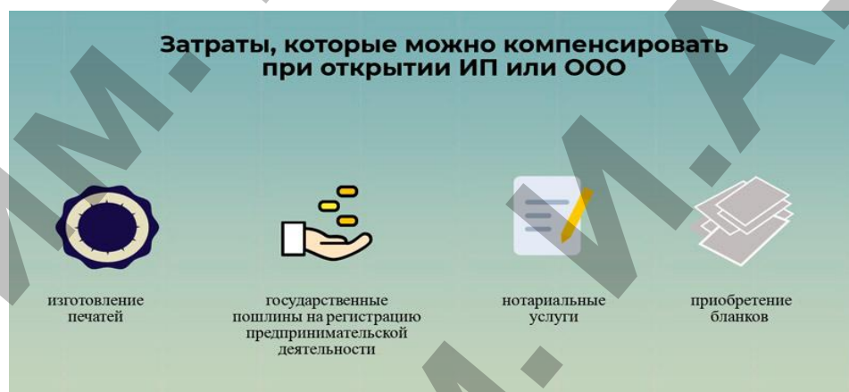
Рисунок 1. Затраты, которые можно компенсировать при открытии ИП или ООО