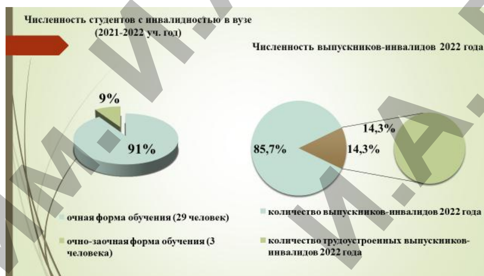
Рисунок 2. Численность студентов с инвалидностью в вузе на 2021-2022 учебный год

Трудоустройство человека с инвалидностью – это процесс не быстрый, необходимо найти работу в соответствии с возможностями и предпочтениями соискателя вакансий. Среди работодателей-партнеров, принимающих на работу выпускников вуза с инвалидностью, следует отметить: