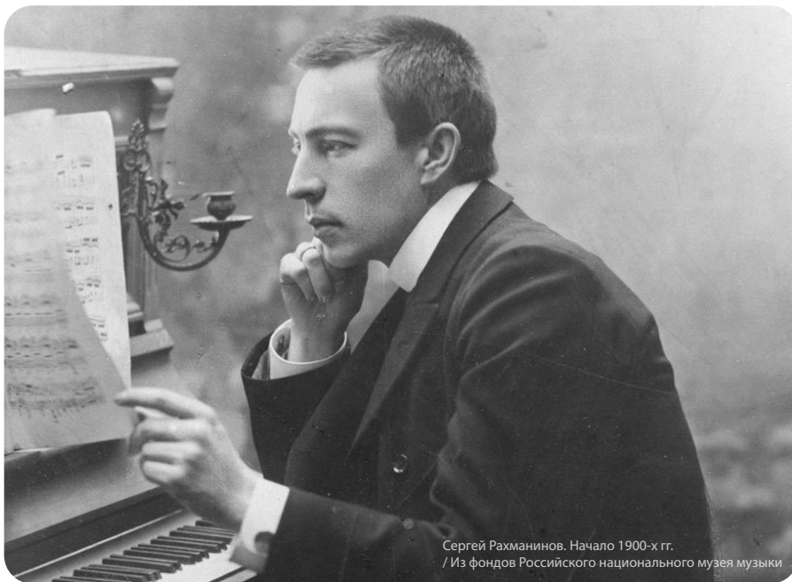
Сергей Рахманинов. Начало 1900-х гг.

В апреле 2023 года музыкальный мир отмечает 150-летие со дня рождения великого русского композитора, пианиста и дирижера Сергея Васильевича Рахманинова.