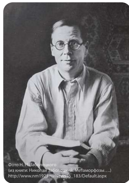
Фото Н. А. Заболоцкого (из книги: Николай Заболоцкий. Метаморфозы...) http://www.nm1925.ru/News16_183/Default.aspx

Н.А. Заболоцкому в равной степени удаются горные, равнинные, лесные, речные, озерные, морские, южные, северные, зимние, весенние, летние, осенние, утренние, дневные, вечерние, ночные пейзажи. Важно отметить, что даже самый обычный