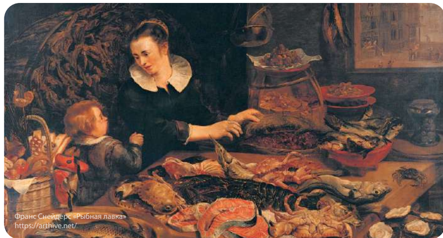
Франс Снейдерс «Рыбная лавка»