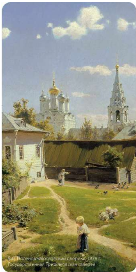
В.И. Поленов «Московский дворик», 1878 г. Государственная Третьяковская галерея