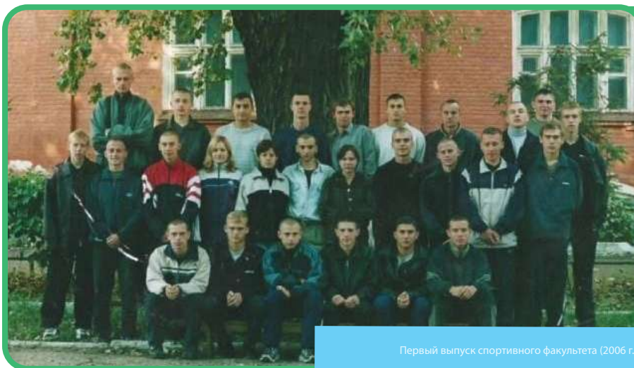
Первый выпуск спортивного факультета (2006 г.)

За 20 лет, благодаря плодотворной деятельности спортивного института, в ЕГУ