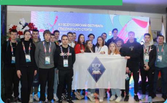
Команда ЕГУ – участница 13-го Всероссийского фестиваля студенческого спорта (2023 г.)