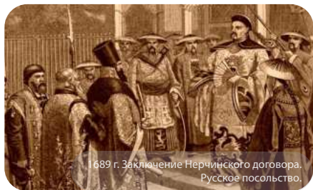
1689 г. Заключение Нерчинского договора. Русское посольство.

Не только беспорядочные походы в Сибирь происходили в это время. На высшем государственном уровне также считали важным найти путь в Китай для возможных торговых связей. Русские хотели опередить в этом процессе Англию и попасть в Китай с севера. Между Китаем и Россией лежала Монголия — страна гораздо более протяженная, чем ныне.