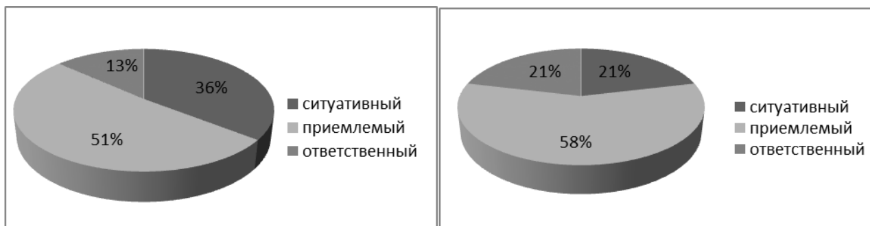
Рисунок 3 – Сравнение уровней гражданственности обучающихся в КГ (слева) и ЭГ (справа) по итогам формирующего этапа эксперимента (в %)

Для диагностики гражданственности по выделенным критериям на формирующем этапе эксперимента использовались те же методики, что и на констатирующем этапе. Следует отметить, что в КГ и в ЭГ прослеживалась устойчивая тенденция к уменьшению количества обучающихся, находящихся на ситуативном уровне сформированной гражданственности, и одновременно выявлялось увеличение их численности на ответственном уровне. Особо подчеркнем, что такие позитивные изменения в ЭГ происходили намного быстрее и выражались в значимом увеличении (по результатам итогового контроля) количества обучающихся в ЭГ, достигающих ответственного уровня гражданственности (10 обучающихся – 21 %) по сравнению с КГ (6 обучающихся – 13 %), что представлено на рисунке 3.