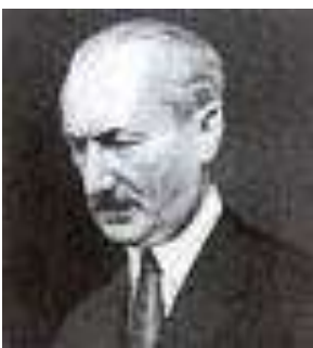
Мартин Хайдеггер 1889 - 1976

С какими чаяниями человек подходит к новому веку? Любые вехи ему свойственно воспринимать как некие пределы, за которыми открывается лучшая жизнь. Появляется больше оснований для упований и надежд. При всем пафосе любого серьезного рубежа, не совсем так было в эпоху вхождения в новый XX век. Такой совокупности проблем и нерешенных вопросов не было ни в одном вековом рубеже из тех, которые были осмыслены в культуре так же серьезно и основательно. Но к философии предъявлялись особые требования.